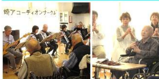
高崎アコーディオンサークル

を浴びて少しずつ成長しています。そんな植物たちの様子をご利用者の皆さんにも観察して頂いたり、職員間でも「小さな芽が出たよ！」等日々情報交換しています。育てるのは容易なこと